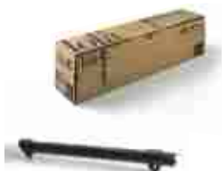
LOLA listwa zębata nylonowa M4, w odcinkach po 0,5 metra, pakowana po 10 sztuk, cena za 1mb