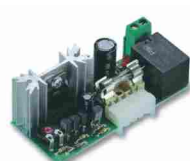
CARICA karta ładowania akumulatorów do siłownika RO1124