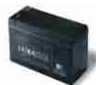
B12-B akumulator 12 V 6.0 Ah do siłownika RO1124