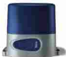
RO300 siłownik 230V z wbudowaną centralą sterującą