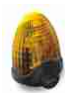
LUCY0 lampa sygnalizacyjna 230V