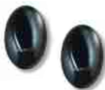
BF fotokomórki (para), zasięg 15 - 30 m