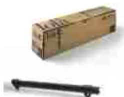
LOLA listwa zębata nylonowa M4, w odcinkach po 0,5 metra, pakowana po 10 sztuk, cena za 1mb