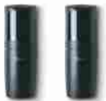
F210B fotokomórki (para) BLUEBUS, nastawna z kątem 210°, zasięg 15 - 30 m