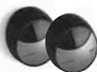
MOFB 1 komplet fotokomórek BLUEBUS