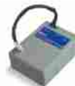
PS124 akumulator 24V 1.2 Ah z wbudowaną kartą ładowania