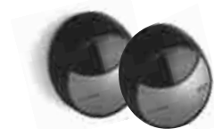
MOFB fotokomórki (para) BLUEBUS, zasięg 15 - 30 m