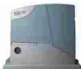
ROBUS350 siłownik 24V z wbudowaną centralą sterującą BLUEBUS